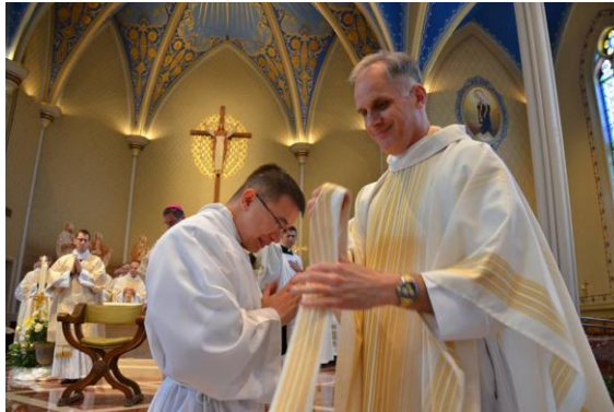
Nước mắt hạnh phúc khi Tân Linh Mục được mặc áo lễ.

Các Tân Linh Mục sau đó thay phẩm phục và chuẩn bị cùng Dâng Thánh Lễ với 2 Đức Cha và các Linh Mục Khác. Khung cảnh thật trang nghiêm, ấm cúng và Thánh thiện