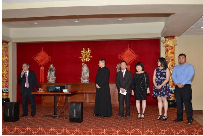
Gia Đình Tân Linh Mục. Cha là con trai đầu.