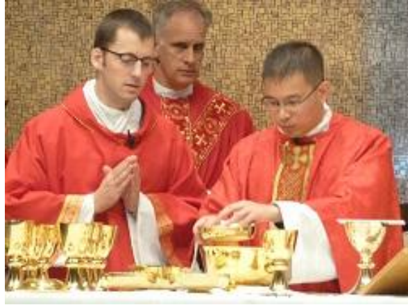
Thánh Lễ đồng tế mở tay. Giáo xứ của Cha Linh Hường.

Sau Thánh Lễ, Giáo xứ mở tiệc thật linh đình để đón Tân Linh Mục, cũng là người con tinh thần của Cha sở và của Giáo Xứ.