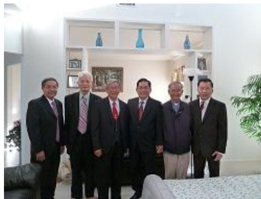
Chuẩn bị đi Fayette Ville