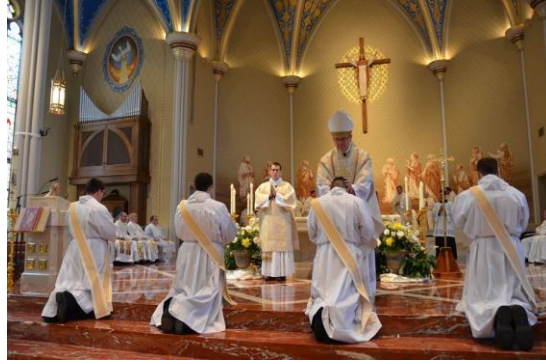
Đức Giám Mục Đặt tay truyền chức Linh Mục.

Các Tân Linh Mục sau đó thay phẩm phục và chuẩn bị cùng Dâng Thánh Lễ với 2 Đức Cha và các Linh Mục Khác. Khung cảnh thật trang nghiêm, ấm cúng và Thánh thiện