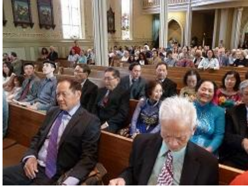
Trong Thánh Đường. Chuẩn bị Thánh Lễ.