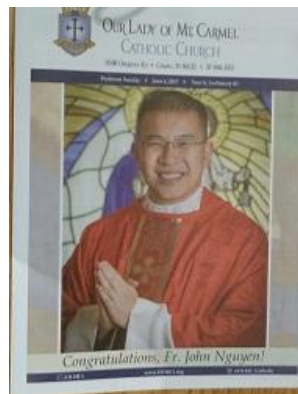
Hình in trên bản tin của Giáo Xứ.